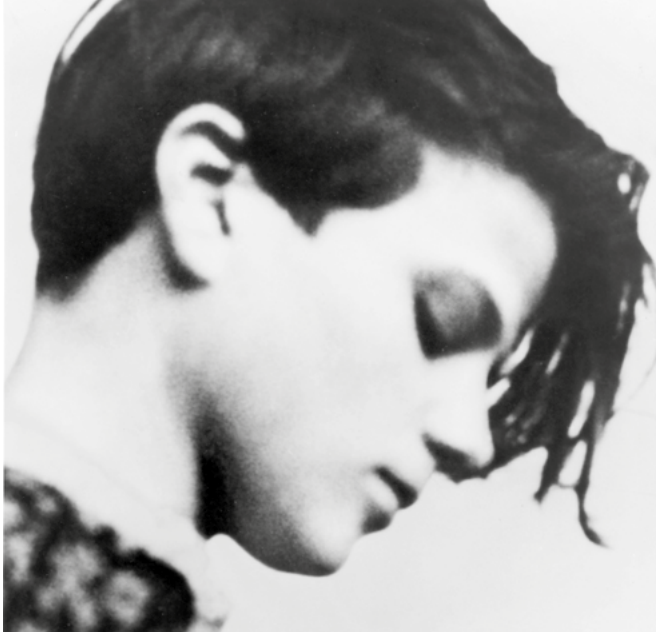
Sophie Scholl, 1940