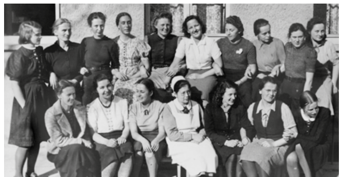
Sophie Scholl (à gauche) au cours d'institutrice, 1941

En mars 1940 Sophie Scholl passe le bac. Elle suit ensuite un apprentissage pour devenir institutrice en école maternelle. Avant de pouvoir faire des études, elle doit effectuer douze mois de service du travail et de service auxiliaire. A partir de mai 1942 elle étudie la biologie et la philosophie à l'Université Ludwig-Maximilians à Munich, où elle vit avec son frère Hans. Elle fait la connaissance de ses amis et intègre vite le groupe. Ensemble ils assistent aux cours du professeur de philosophie Kurt Huber.