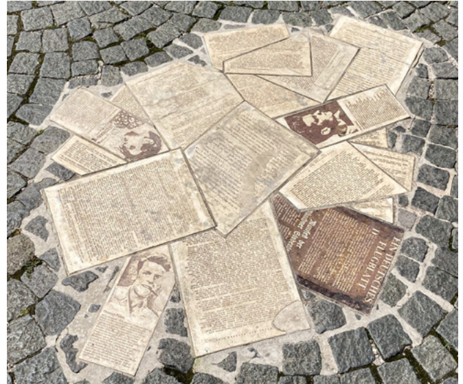
Monument devant l'Université Ludwig-Maximilians de Munich, 2020

Plusieurs films ont été tournés sur la vie de Sophie Scholl.