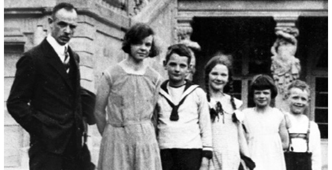
Sophie Scholl (2ème à droite) avec son père et ses frères et sœurs, vers 1930

Sophie Scholl grandit dans une famille chrétienne aux idées politiques libérales. Elle aime dessiner, écrire et la musique. Elle joue du piano et fait de la danse.