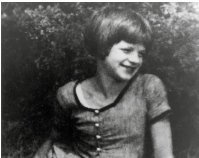
Sophie Scholl à douze ans, 1933